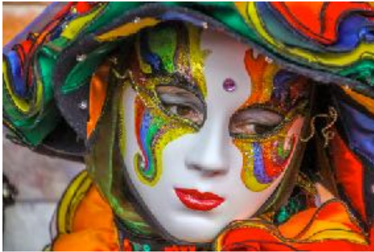
Maske in Venedig