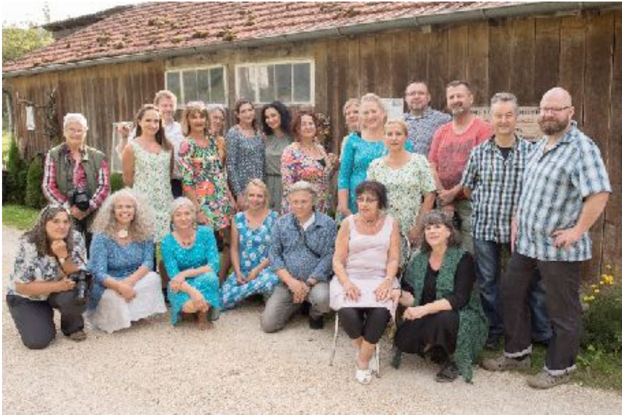
Die Gruppe des Modellshootings 2019 mit Fotografen und Models und der Boutique „Wohlfühl Dinge“ in Burladingen von Joachim Wolfer