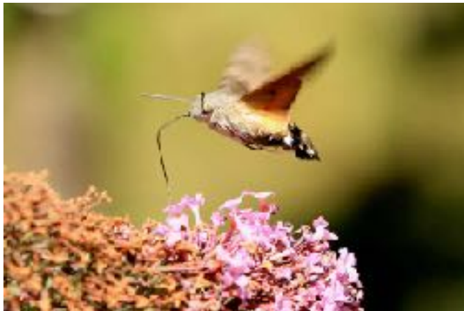
Bild: Taubenschwänzchen