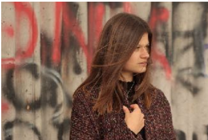
Bild: Modellshooting beim Vereinsausflug