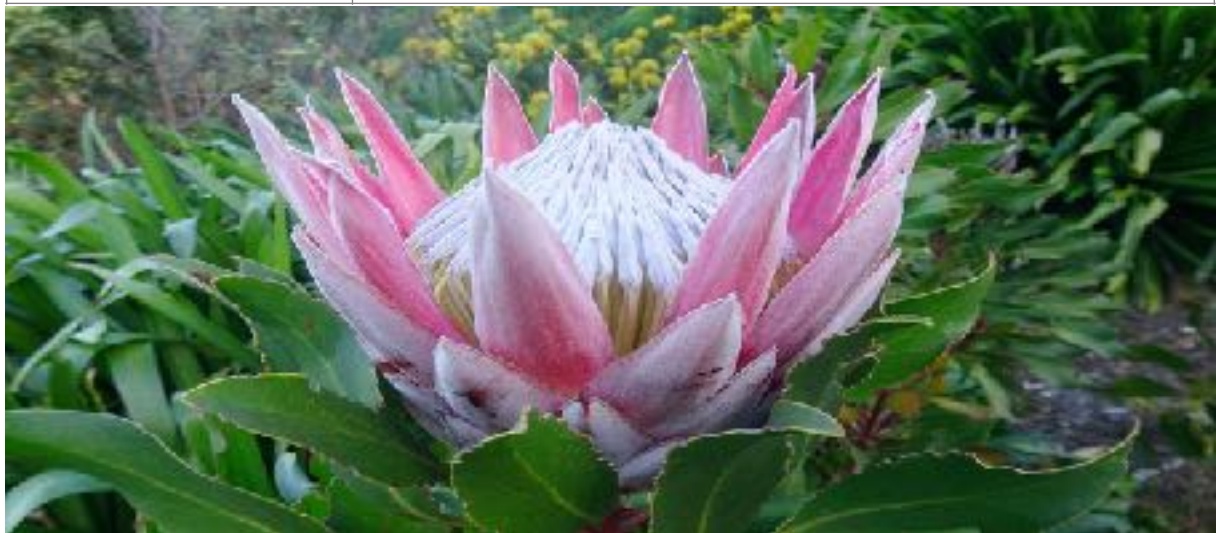
Proteaceaeart