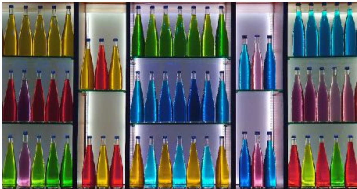
eingereicht beim Wettbewerb 2019 „besondere Themen“